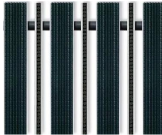
Gummi schwarz Bürstenleiste schwarz | grau