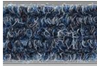
040 Blau meliert

Weitere Farben als Sonderfarben möglich.