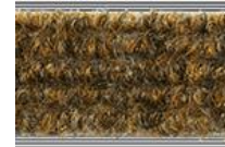
030 Beige meliert