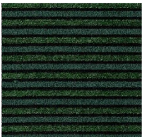
9708 green bellagio NSC S 9000-N / S 8010-G30Y / S 8010-B90G LRV 2 %

- dient zur Senkung von Beleuchtungskosten durch Erhöhung der Lichtreflektion