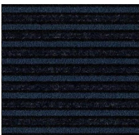
9747 azul imperial NSC S 9000-N / S 7020-R90B / S6030-R90B LRV 1 %