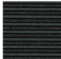
9721 dark steel NSC S 9000-N / S 8502-B LRV 2 %