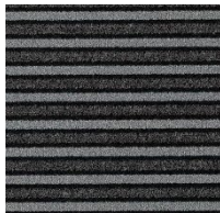
9710 luna pearl NSC S 9000-N / S 7502-B LRV 4 %